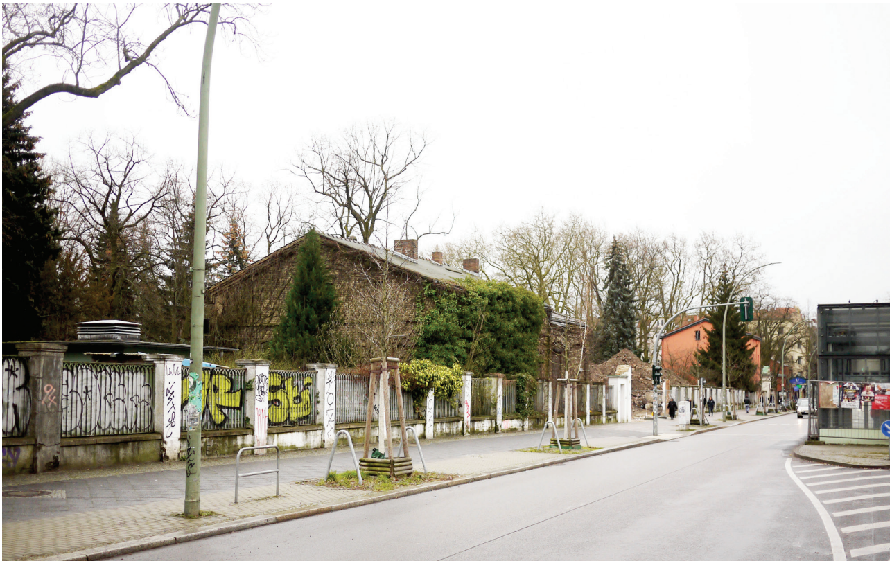
Bestandsgebäude an der Hermannstraße mit straßenbegleitenden Zaun, rechts Aufzug zum U-Bahnhof Leinestraße