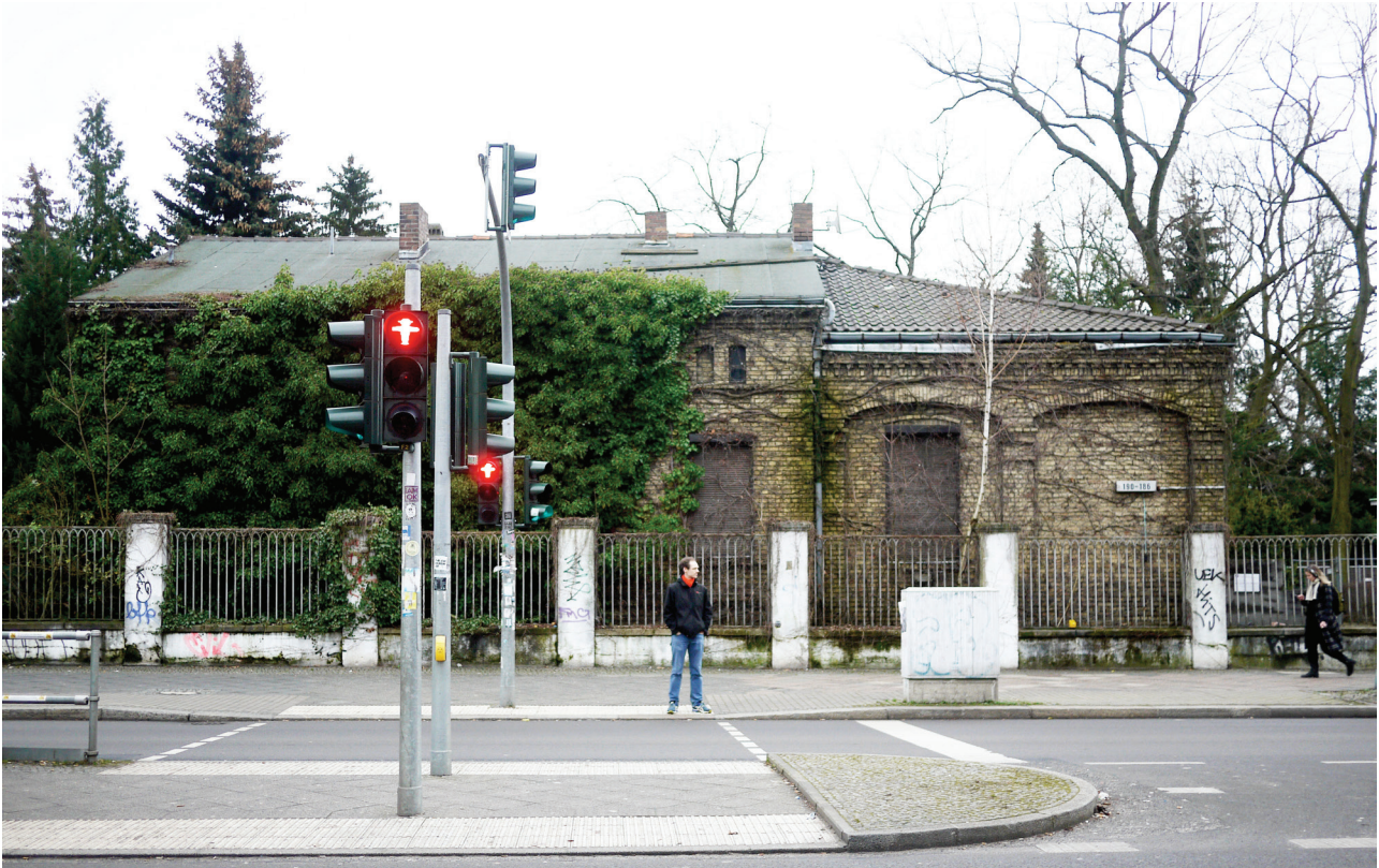
Bestandsgebäude an der Hermannstraße