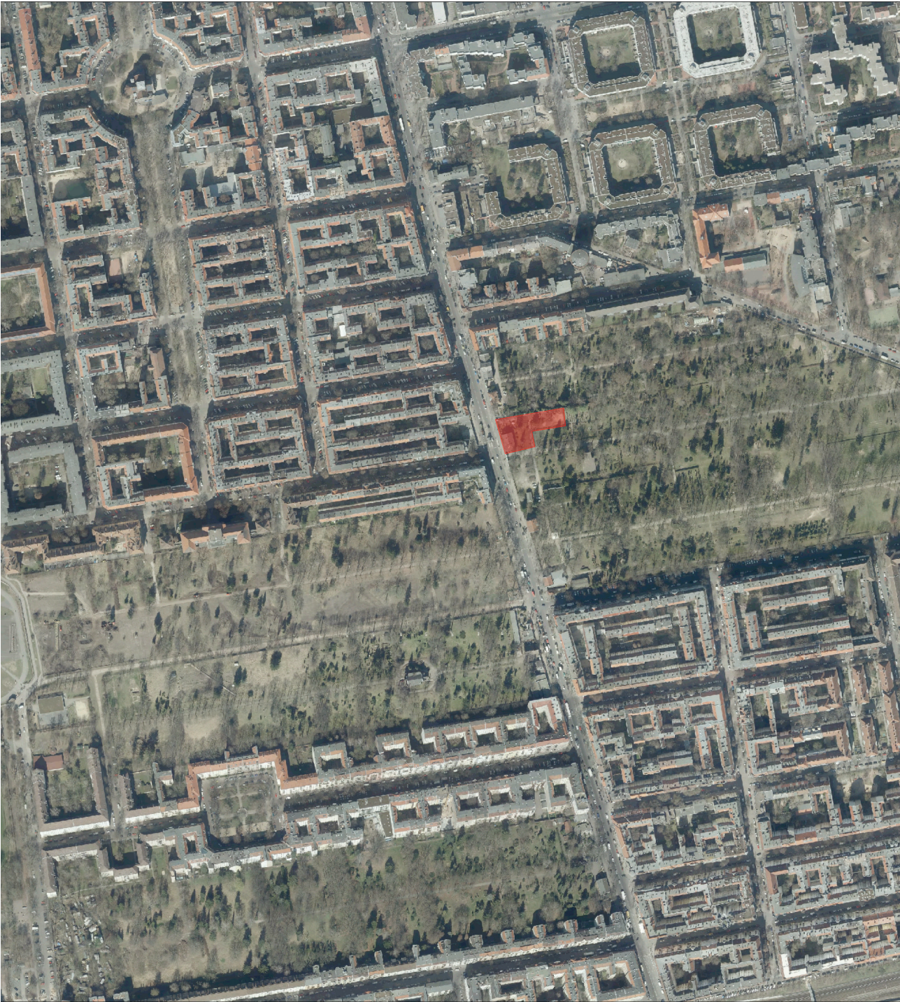
Luftbild Friedhöfe an der Hermannstraße