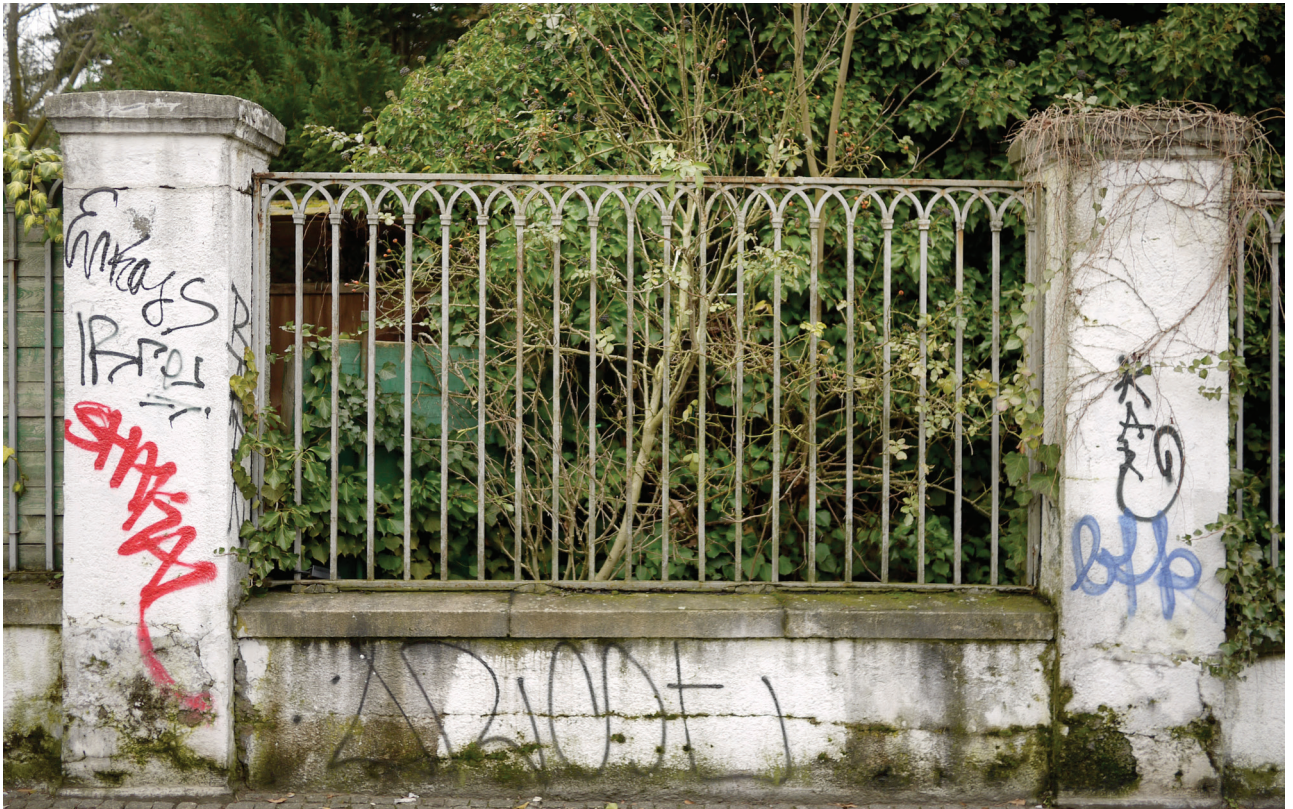
Zaunelement an der Hermannstraße