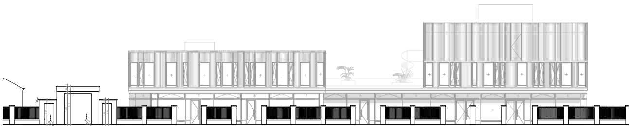
Projekt für den Friedhofsverband und Stattbau auf dem benachbarten Grundstück (CKRS Architektengesellschaft mbH)