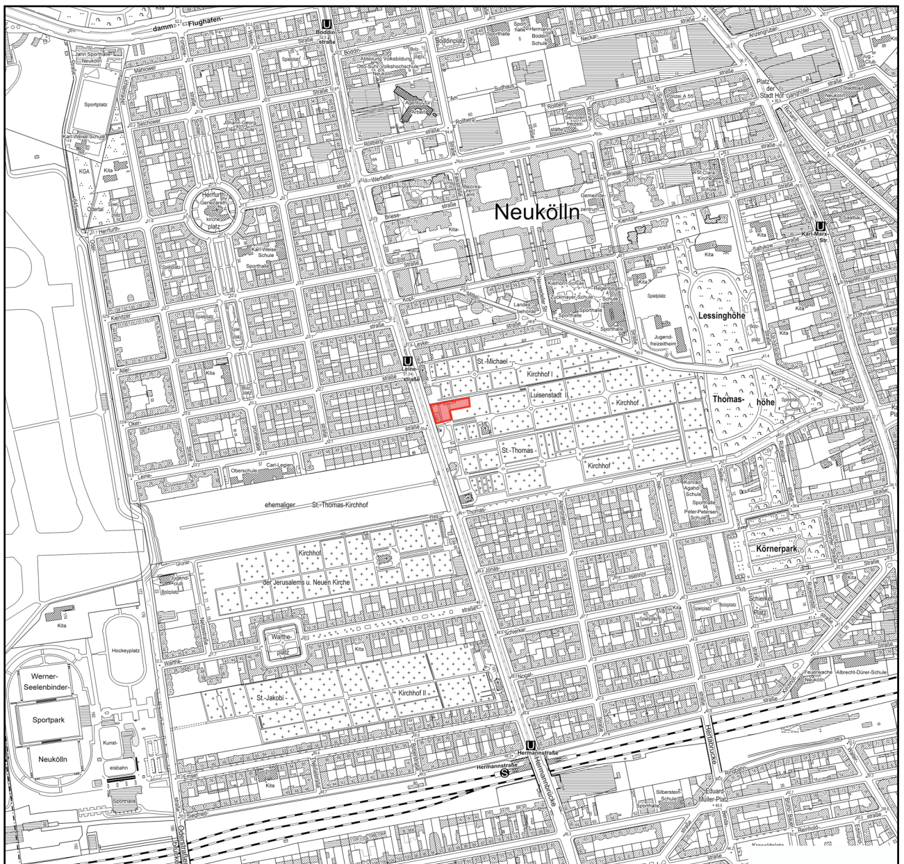
Übersichtplan Mst. 1:10.000, links Tempelhofer Feld, unten S-Bahn-Ring