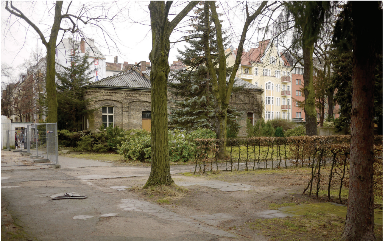
Bestandsgebäude und Grundstück vom Friedhof aus